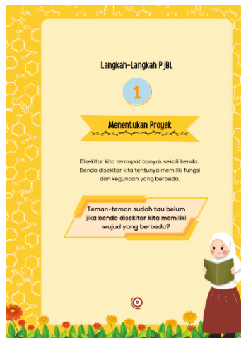
Gambar 3. Tampilan Materi