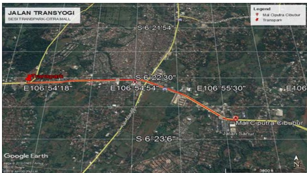
Gambar 2 Lokasi penelitian