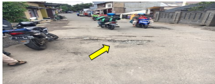
Gambar 2 Kerusakan Pada Jalan Arzimar STA 0+800 - STA 0+950

Pada STA 0+850, kondisi jalan yang menanjak dan kurang berfungsinya saluran drainase mengakibatkan limpahan air pada waktu hujan sangat deras dan mengikis permukaan jalan yang ada, sehingga terjadinya kerusakan jalan berlubang (Gambar 2).