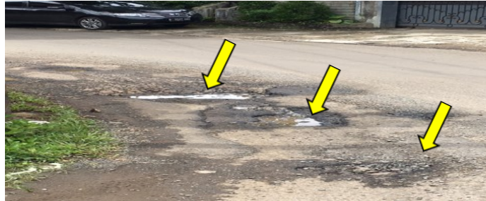
Gambar 1 Kerusakan Pada Jalan Arzimar STA 0+200 - STA 0+400

Jalan Arzimar terletak di Kecamatan Bogor Utara Kota Bogor, merupakan jalan kota yang padat akan aktifitas kegiatan lalu lintas kendaraan roda dua dan kendaraan roda empat di kawasan tersebut. Jalan Arzimar merupakan jalan penghubung dari Jalan Achmad Sobana ke Jalan Bogor Baru di sebelah Utara.