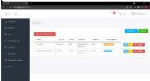
Gambar 4. Halaman manajemen cuti karyawan

Pada halaman ini menampilkan halaman manajemen Cuti Karyawan, untuk lebih jelasnya dapat dilihat pada Gambar 4