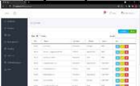
Gambar 3. Halaman manajemen Karyawan

lebih jelasnya dapat dilihat pada Gambar 3