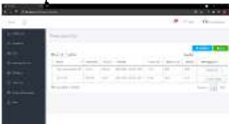
Gambar 5. Halaman manajemen persetujuan cuti

Pada halaman ini menampilkan halaman manajemen Persetujuan Cuti, untuk lebih jelasnya dapat dilihat pada Gambar 5