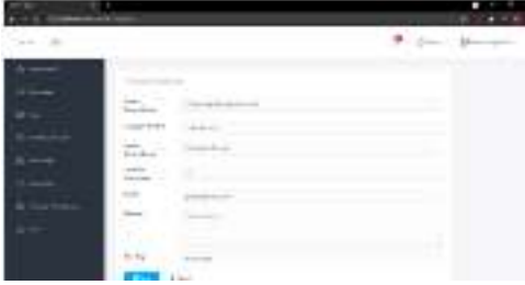
Gambar 9. Halaman Manajemen tentang perusahaan