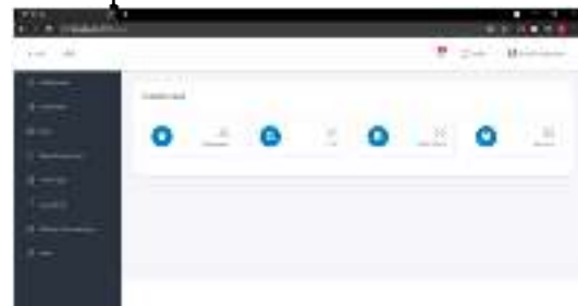
Gambar 2. Halaman Dashboard

Pada halaman ini menampilkan halaman dashboard, untuk lebih jelasnya dapat dilihat pada Gambar 2