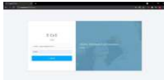
Gambar 1. Halaman login

Pada halaman ini menampilkan form login untuk masuk kedalam sistem, untuk lebih jelasnya dapat dilihat pada Gambar 1