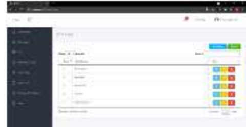
Gambar 6. Halaman manajemen unit kerja

Pada halaman ini menampilkan halaman manajemen unit kerja, untuk lebih jelasnya dapat dilihat pada Gambar 6