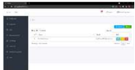
Gambar 8. Halaman Manajemen user

Pada halaman ini menampilkan halaman manajemen user, untuk lebih jelasnya dapat dilihat pada Gambar 8.