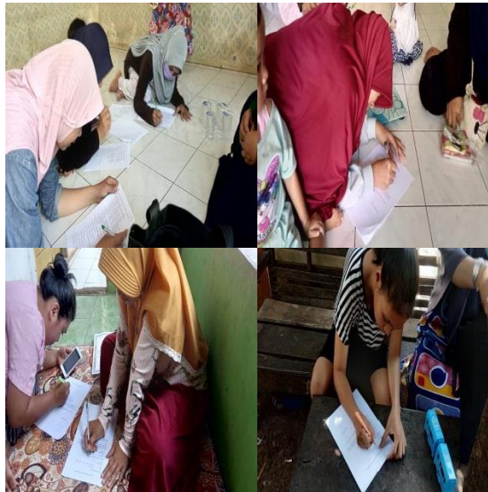
Gambar 3. Pengisian kuesioner pre-test secara door-to-door

Berdasarkan Gambar 3. Dalam pengisian kuesioner pre-test secara door-to-door di Kp. Sumurwangi RW 08 untuk memperoleh data primer mengenai pengetahuan ibu, perilaku ibu, sikap ibu dan lingkungan sekitar dan untuk mengetahui sejauh mana upaya peningkatan kepatuhan adaptasi kebiasaan baru pada ibu dengan balita.