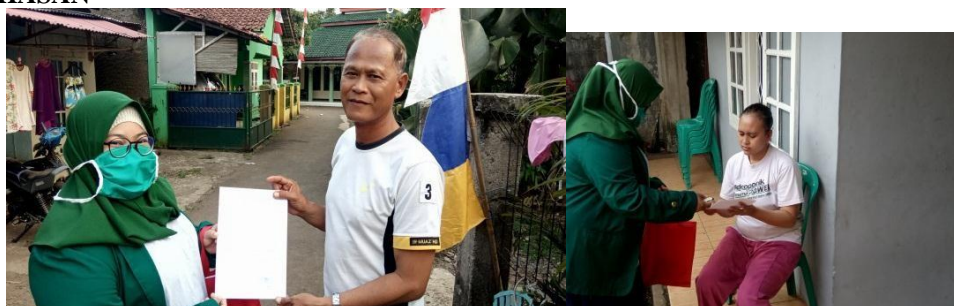
Gambar 1. Perizinan dengan mitra

Berdasarkan Gambar 1. Dalam tahap awal dalam perizinan dengan mitra dipaparkannya pembahasan mengenai permintaan perizinan untuk dilakukannya survey di wilayah Rw 08 dan permintaan data ibu dengan balita untuk populasi dan sampel yang akan digunakan untuk survey dan melakukan pemaparan tentang apa saja kegiatan-kegiatan, kuesioner yang akan ditanyakan kepada sampel untuk Upaya Peningkatan Kepatuhan Penerapan Adaptasi Kebiasaan Baru pada Ibu dengan Balita di wilayah Kp. Sumurwangi Rw 08 Kelurahan. Kayumanis.