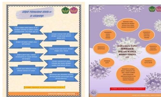
Gambar 4. Penyuluhan menggunakan media poster melalui daring

Berdasarkan Gambar 3. Dalam pengisian kuesioner pre-test secara door-to-door di Kp. Sumurwangi RW 08 untuk memperoleh data primer mengenai pengetahuan ibu, perilaku ibu, sikap ibu dan lingkungan sekitar dan untuk mengetahui sejauh mana upaya peningkatan kepatuhan adaptasi kebiasaan baru pada ibu dengan balita.