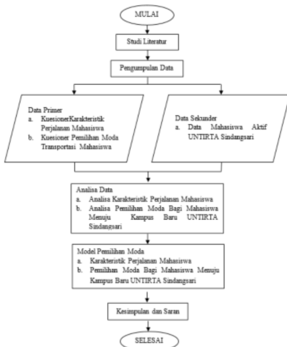
Gambar 1. Bagan Alir Penelitian

Bagan alir penelitian dapat dilihat pada gambar berikut ini.